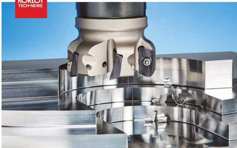
Alpha Mill X